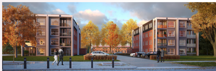
Een impressie van de nieuwbouw aan de Sportlaan.