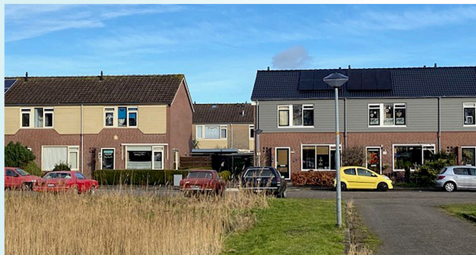
Links de oude situatie (geel) en rechts de nieuwe (grijs).

Het gaat onder andere om woningen in de D.C. Rezelmanstraat, de J.C. van Wijkstraat en de Burg. Perksingel. Het complete overzicht zien? Kijk op www.wsap.nl .