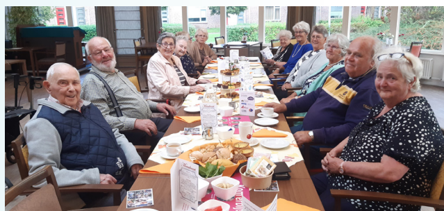
De Buurtkamer in De Carrousel (foto via Wonen Plus Welzijn).

Deze Buurtkamers worden mede mogelijk gemaakt door bewoners, vrijwilligers, Woonzorggroep Samen, Woningstichting Anna Paulowna en gemeente Hollands Kroon en dankzij subsidie via de Hollands Kroonse Uitdaging. Meer weten? Kijk op www.wonenpluswelzijn.nl .