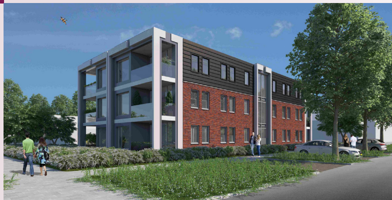
Impressie van de nieuwbouw aan de Cornelis Keijzerlaan.