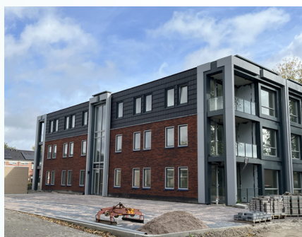
Het nieuwe pand aan de Cornelis Keizerlaan

Aan de buitenkant is het nieuwbouwpand aan de Cornelis Keizerlaan zo goed als af. De bergingen zijn geplaatst en momenteel wordt er hard gewerkt aan de inrichting van het openbaar gebied. Ook binnen wordt er volop gewerkt aan de laatste loodjes waaronder de aansluitingen voor water en elektra. Voor de bewoners komt de verhuizing steeds dichterbij; begin oktober heeft er een inmeetmoment plaatsgevonden. De nieuwbouw aan de Sportlaan wordt momenteel bekleed met aluminium gevels, daarna zal ook hier de binnenkant verder worden afgewerkt. Ook is bekend geworden dat de nieuwbouw aan de Molenvaart 12-14 doorgang kan vinden.