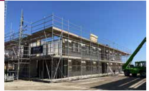
de nieuwe appartementen krijgen steeds meer vorm

Kijk voor meer informatie over onze nieuwbouwprojecten op onze website: www.wsap.nl/nieuwbouw .