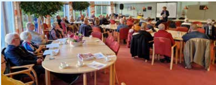
Indruk van onze jaarvergadering op 12 april 2023

Op 12 april vond onze jaarvergadering plaats, voor alle huurders van Woningstichting Anna Paulowna. De jaarvergadering stond grotendeels in het teken van de (her)verkiezing van bestuursleden, het (financiële) jaarverslag en een presentatie van Wonen Plus Welzijn. De tijd na de pauze is besteed aan uiteenlopende vragen van huurders. Kijk voor een uitgebreid verslag op www.shwap.nl .